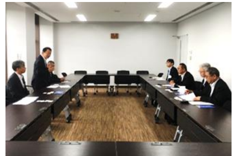
女満別空港関係先及び北見・網走・ 美幌商工会議所との情報交換会