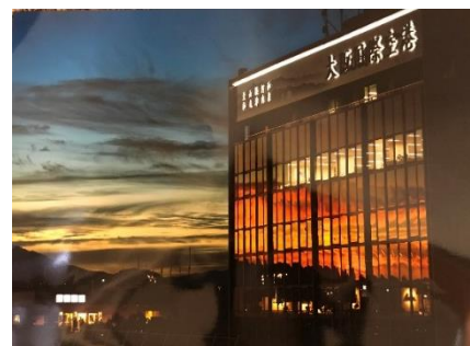
空港活性協会長賞