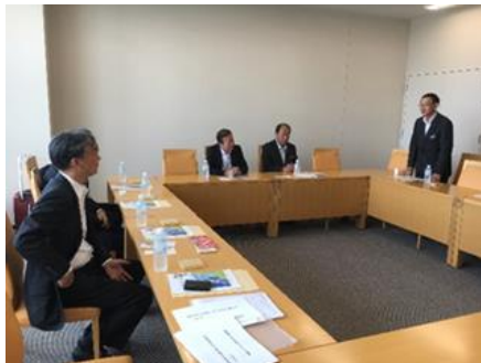
旭川空港関係先及び旭川商工会議所 との情報交換会

当協議会は8月21日(水)に旭川空港関係先及び旭川商工会議所、22日(木)に女満別空港関係先及び北見・網走・美幌商工会議所と情報交換会を開催しました。