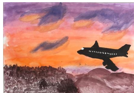
空港活性協会長賞

2019年11月9日(土)～11月17日(日)9:00～20:00に伊丹スカイパークパークセンター内多目的室に優秀20作品、選出10作品、総数30作品を展示しました。