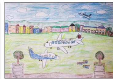
大阪国際空港及びその周辺地域 活性化促進協議会会長賞 (空港活性協会会長賞)

写生大会は、7月27日(水)から29日(金)までの3日間、(7月26日(火)実施予定が、雨天のため順延)、大阪国際空港展望デッキ「ラ・ソーラ」で行われ、空港周辺(伊丹市、川西市、吹田市、宝塚市、豊中市、箕面市、池田市)の小学生を中心に、748人が参加しました。